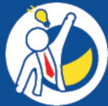
Einführung und Optimierung

Erhöhen Sie Ihre Produktivität und erhalten Sie Ihre Rentabilität bei immer kleiner werdenden Werkstücken. Das ISCAR 3P -Team wird Ihnen helfen, Rentabilität und Wettbewerbsfähigkeit zu bewahren.