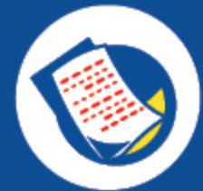
Produktivitätserhöhung & Kostenreduzierung